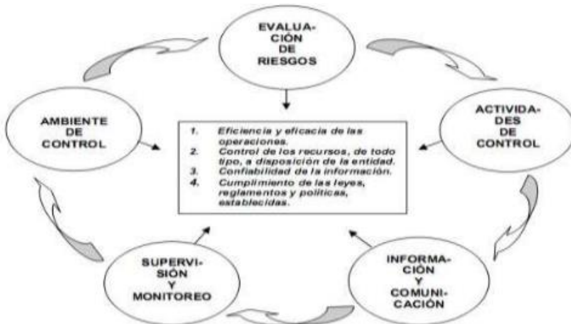
Figura 1. Carácter sistémico de control interno

El control interno comprende las acciones de cautela previa, simultánea y de verificación posterior que realiza la entidad sujeta a control, con la finalidad que la gestión de sus recursos, bienes y operaciones se efectúe correctamente y eficientemente. Su ejercicio es previo, simultáneo y posterior.