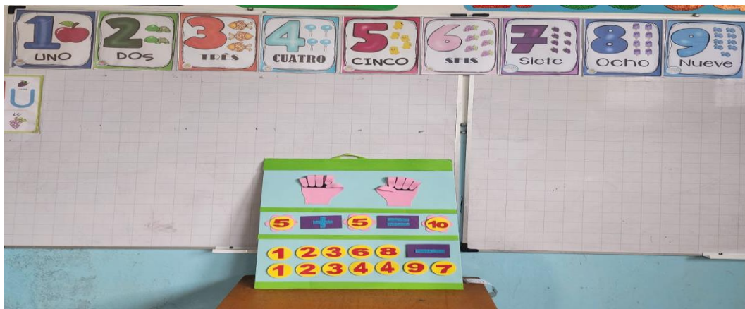
Figura 2: Manitos mágicas

didáctico se aplicó por un periodo de una semana y promovió que los estudiantes obtuvieran un aprendizaje dinámico y lúdico de los conceptos matemáticos básicos.