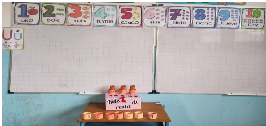
Figura 5: Kit de resta

Recepción: 21/11/2024 / Revisión:20/12/2024 / Aprobación: 20/01/2025 / Publicación: 27/02/2025