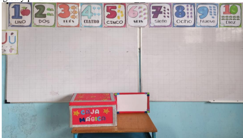
Figura 6: Caja mágica y pizarra.

La caja mágica se aplicó a los estudiantes durante un periodo de 1 semana lo que les permitió observar las cantidades físicas dentro de la caja y manipularlas para ejecutar las operaciones de suma y resta, esto ayuda a comprender el contenido científico que las operaciones de suma y resta son procesos de agregar o quitar objetos. Los estudiantes también pueden usar la caja mágica y la pizarra para resolver problemas prácticos de suma y resta, estimulando la resolución concreta, posteriormente para representar de manera conceptual.